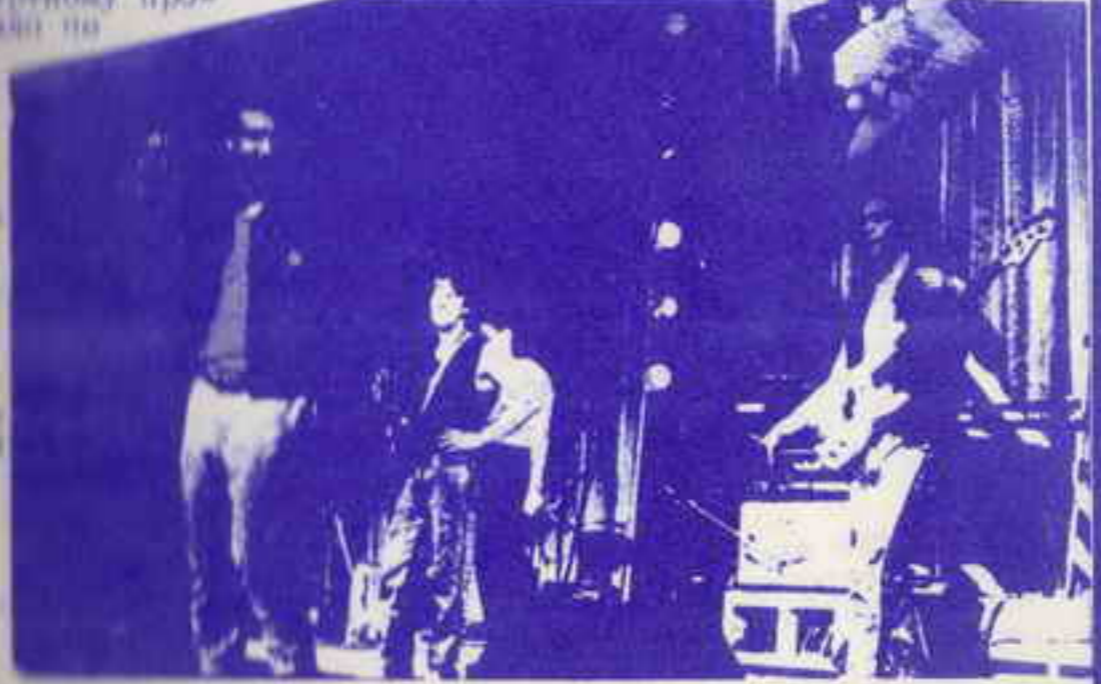
= БОНДА =

Второй же ИСТИНА--запомнилась более всего тем, что перед выступлением был опущен глупый рекламный плакат, представлявший конструкцию из неагруганных досок, на котором/как опять оказалось--было написано это самое слово. Поверим ему, ибо