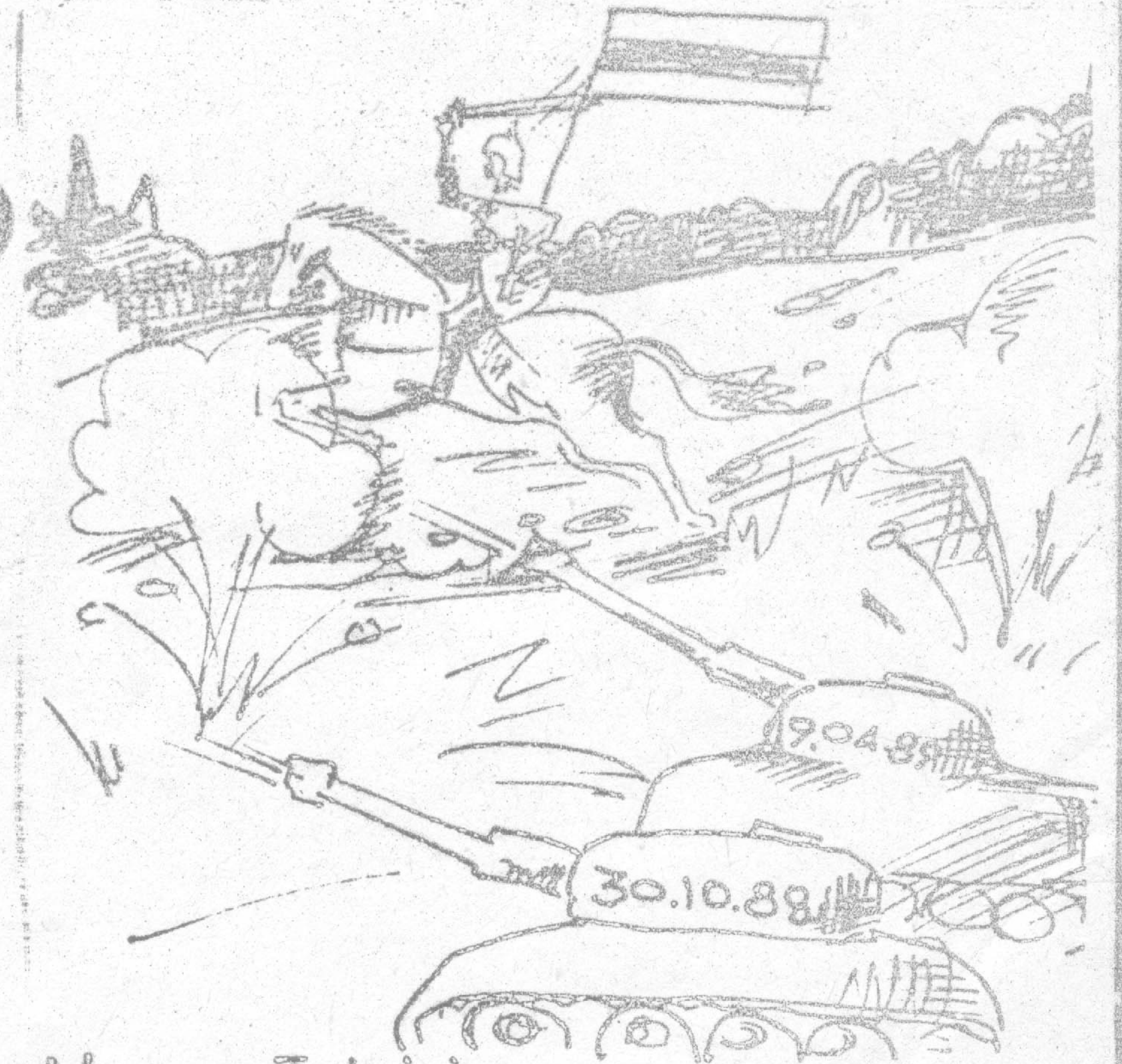
Менск-Тбілісі: шлях перабудовы