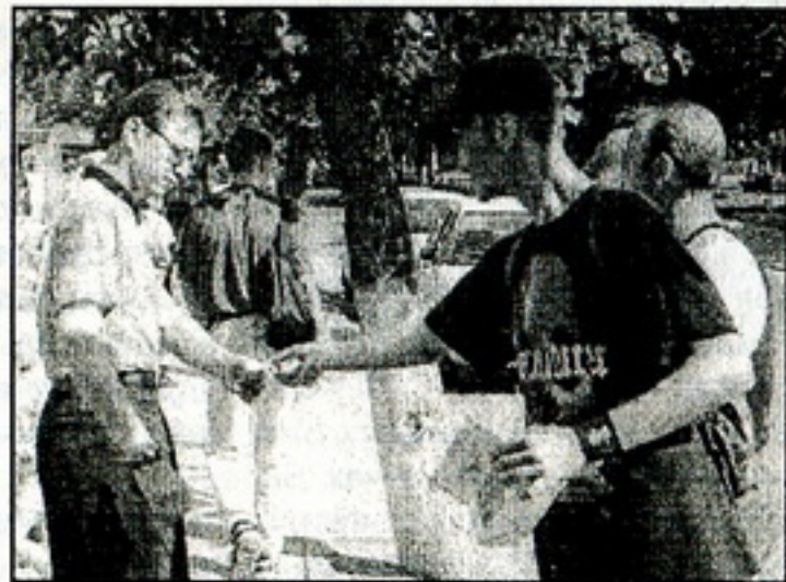
Пікет «Ветразь», ліпень 1999

1998 г., з утварэньнем маладзёжнага аб'яднаньня "Ветразь". У ліпені 1998-га яно было зарэгістравана ўпраўленьні юстыцыі Гарадзенскага аблвыканкама ды распачало сваю дзейнасьць. Сярод статутных мэтаў арганізацыі ёсьць і такія: адраджэньне і разьвіцьцё нацыянальных, культурных традыцыяў роднага краю. "Ветразь" заяўляў пра сваё імкненьне аб'ядно-